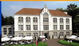
Mit Mut und Erfahrung Zukunft gestalten.