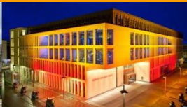
Mit Mut und Erfahrung Zukunft gestalten.